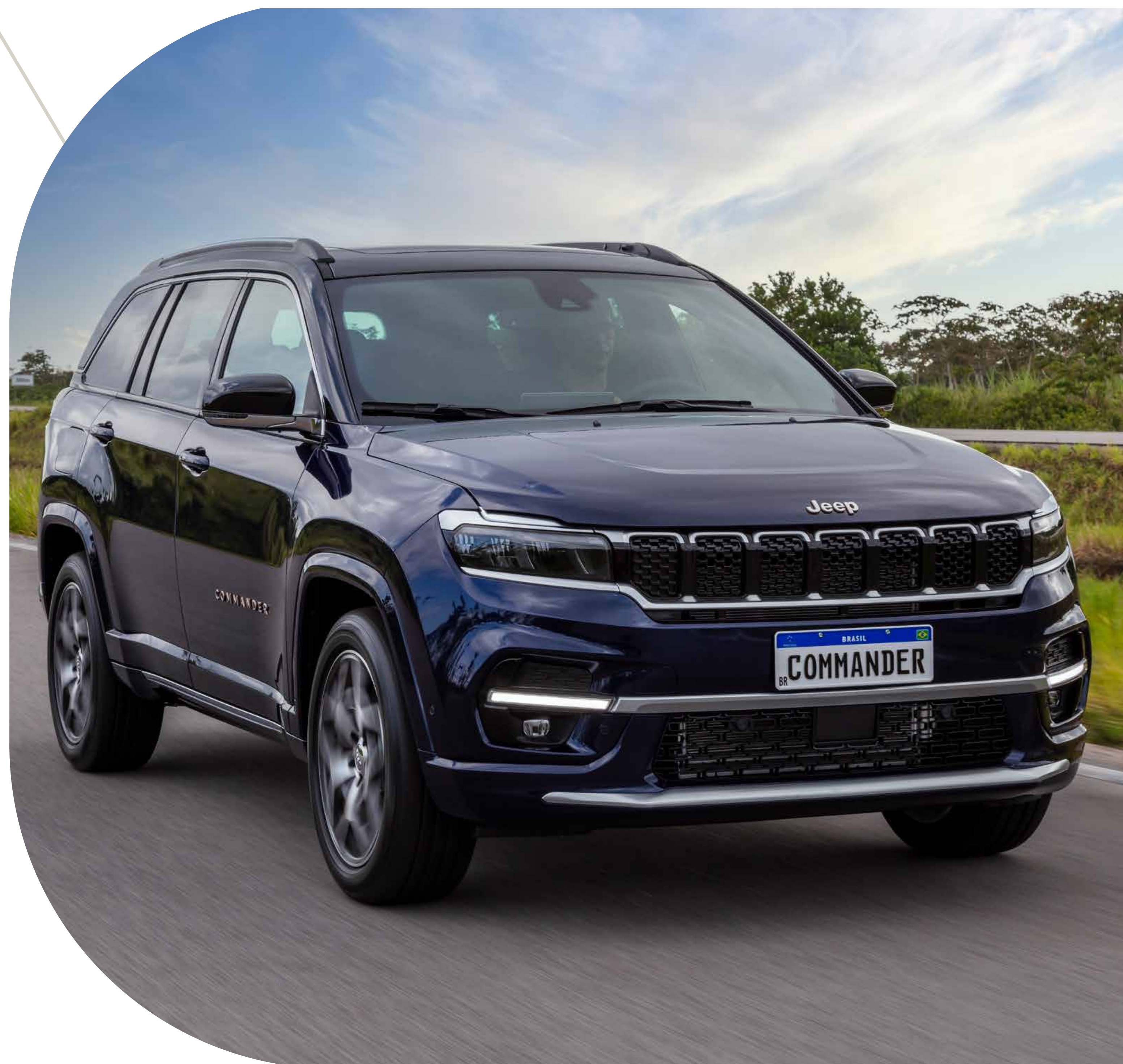
LIMITED ARO 18"