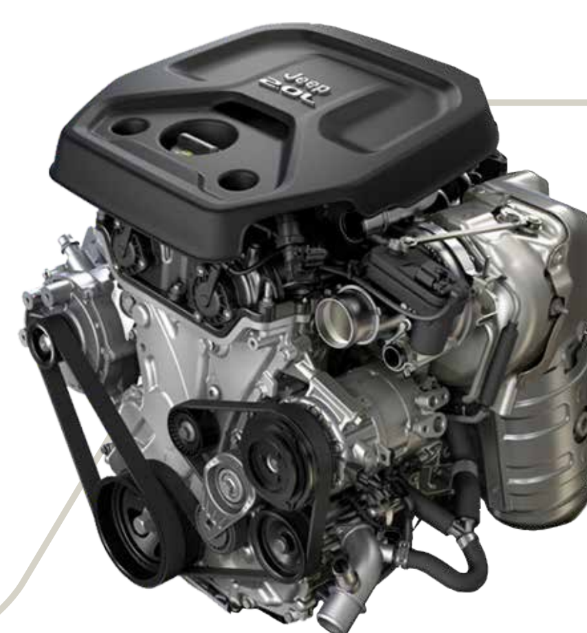
MOTOR T270 FLEX