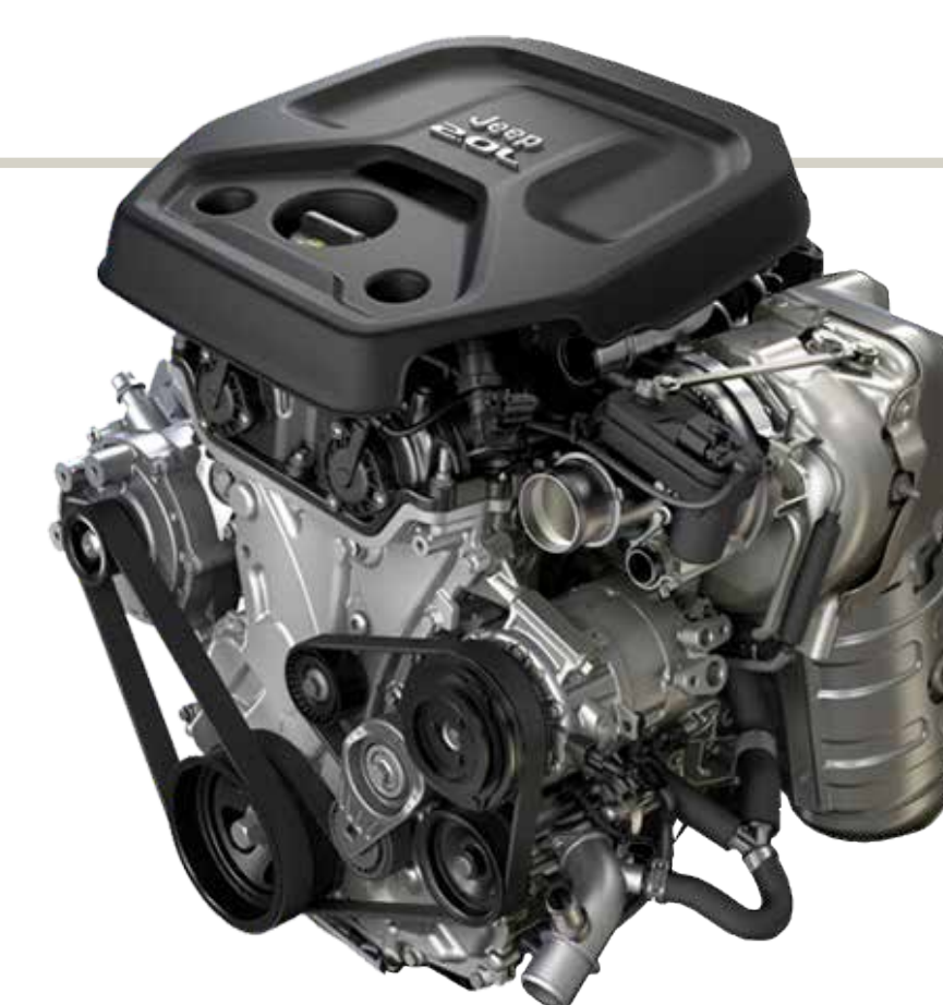
MOTOR TD 380 4X4 DIESEL